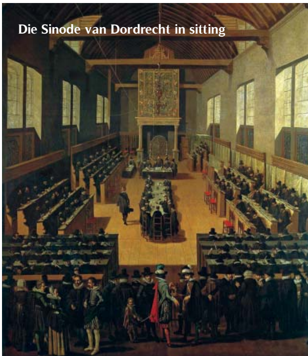
Die Sinode van Dordrecht in sitting

D IT IS DIE JAAR 1618. Die Gereformeerde Kerke in Nederland is in beroering. Daar heers 'n felle stryd tussen Gereformeerdes ... en dit oor sekerlik die heerlikste taak waarvan die Bybel getuig, die hartaar van die evangelie – die belydenis van God se genade. Die strydpunt het uitgeloop op die Sinode van Dordrecht in 1618-1619 waartydens die Dordtse Leerreëls (ook bekend as die Vyf Artikels teen die Remonstrante) saamgestel is.