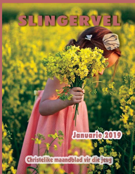
SLINGERVEL, JAARGANG 60 Nommer 1004, Januarie 2019