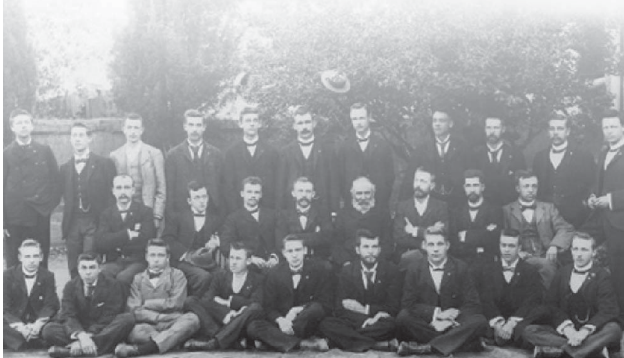
Onder: Dosente en studente van die Teologiese Skool Burgersdorp 1897