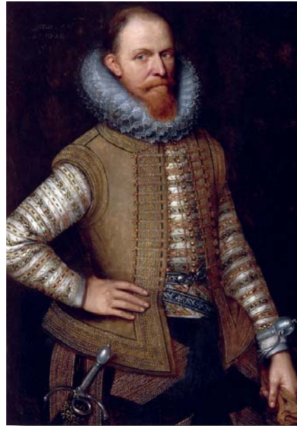
Prins Maurits van Oranje (1567 – 1625)

Op 13 November 1618 het die Sinode begin met afgevaardigdes vanuit al die provinsies asook broeders vanuit Gereformeerde kerke uit ander lande. Die tyd het aangebreek dat die waarheid bely word. DK