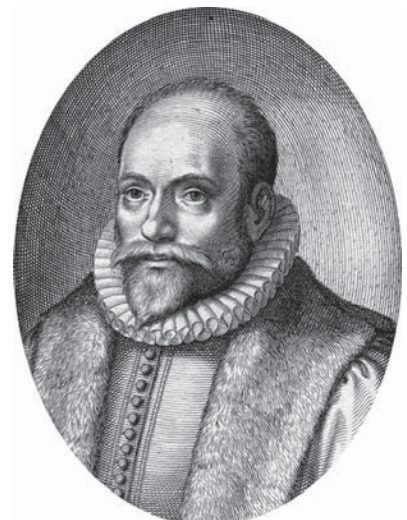
Jacobus Arminius (1560 – 1609)

Arminius se teologie was in wese 'n reaksie-teologie. Hy het hom verset teen die teologie en standpunte van Calvyn en Beza. Vandaar het hy 'n eie rigting ingeslaan. Vir hom het die mens se geloof 'n belangrike rol by die verkiesing gespeel. Ook was hy van mening dat Christus vir alle mense gesterf het en dat om dié rede daar ruimte is vir die vrye wil van die mens. Dit is die mens se keuse of jy die genade van God aanvaar of nie. Dit was volgens Gomarus in stryd met die Woord en met die gereformeerde leer. Tussen dié twee het daar 'n groot kloof ontstaan.