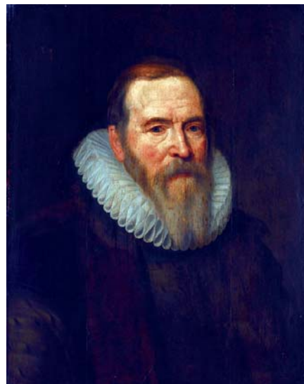
Johan van Oldenbarnevelt (1547 – 1619)