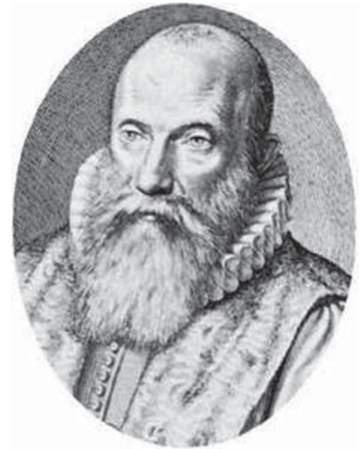
Franciskus Gomarus (1563 – 1641)

Met die aanloop na die sinode het vier persone belangrike rolle gespeel: twee kerklike professore (Gomarus en Arminius) en twee staatkundige leiers (Prins Maurits van Oranje en Johan van Oldenbarnevelt).