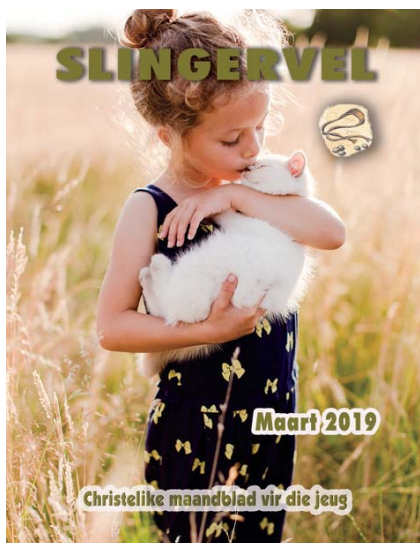
SLINGERVEL, JAARGANG 60 Nommer 1006, Maart 2019

A s julle enige vrae het, iets wat jy nie verstaan nie, of oor iets wat in die Slingervel geskryf is, meer wil weet, is julle baie welkom om vir my ⇒ 'n sms te stuur of te whatsapp na 084 551 2107, ⇒ of 'n e-pos te stuur na slingervel@gksa.co.za , ⇒ of 'n brief te stuur na Posbus 88, Bloemhof 2660