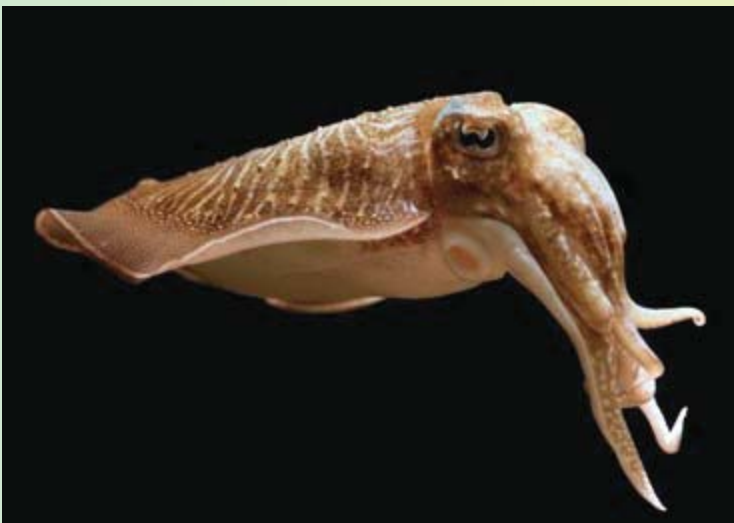
Beenvis / Cuttlefish