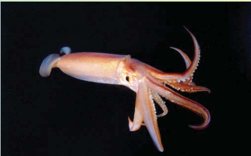
Inkvis / Squid