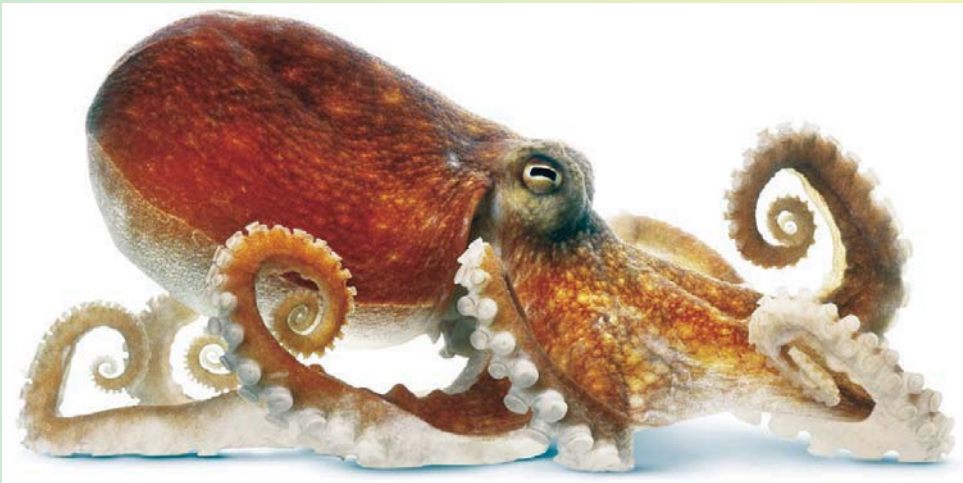
Seekat / Octopus